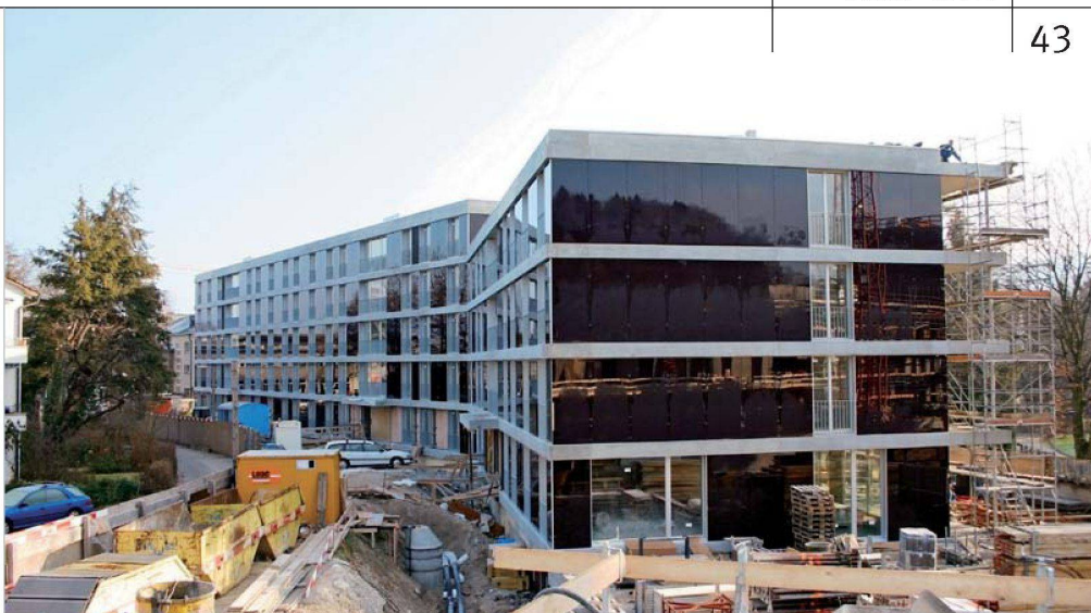
Bei der 2007 fertiggestellten Siedlung Brunnenhof der Stiftung Wohnungen für kinderreiche Familien (Gigon/Guyer) war B & P für die Ausführung verantwortlich (vgl. wohnen 11/07). Trotz klarer Kostenvorgabe konnten attraktive Glasfassaden verwirklicht werden. Heute wäre dies zum gleichen Preis nicht mehr möglich.

Wir haben die Erstellungskosten von zehn neuen genossenschaftlichen Siedlungen verglichen, die im vergangenen Jahr in Zürich