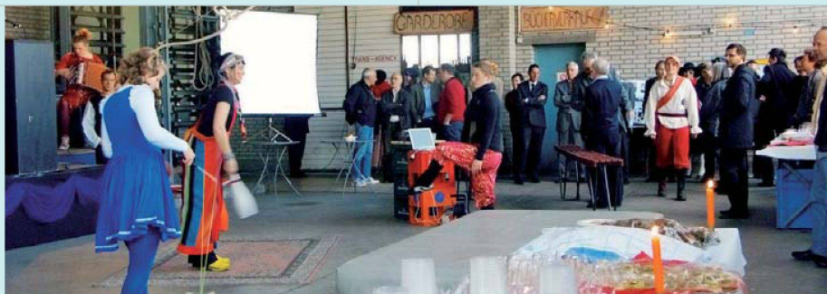
Der Zirkus Chnopf untermalte den Abschluss des Zürcher Jubiläumjahres.

meindeordnung, die die Kostenmiete als Vermietungsprinzip für alle städtischen Wohnungen verankert und ein Angebot an preisgünstigen Geschäftsräumen sicherstellt. Eine Ausnahmebestimmung soll gewährleisten, dass Luxuswohnungen und andere besondere Mietobjekte nicht nach den Prinzipien der Kostenmiete bewirtschaftet werden müssen. (pd)