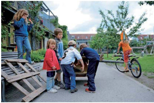
In der autofreien Siedlung können sich kleine und grosse Kinder ungestört austoben.