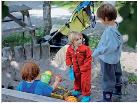
200 Kinder wohnen in der Siedlung Strassweid – das geht nicht ohne Lärm.