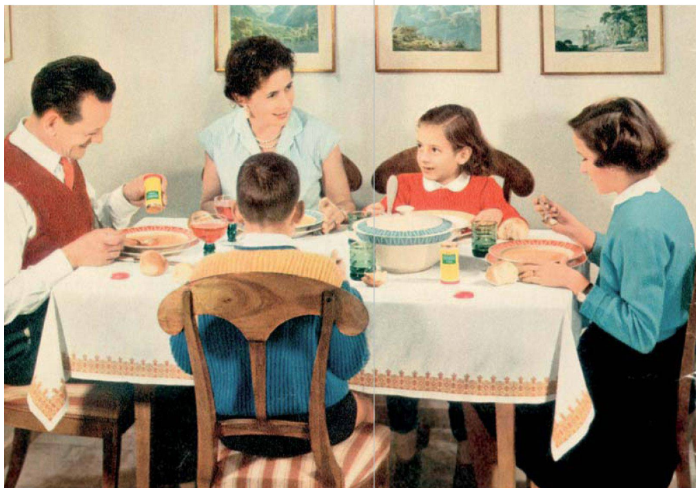
Die Werbung für die Streuwürze Aromat aus den Sechzigerjahren zeigt das damalige Ideal der bürgerlichen Kleinfamilie.