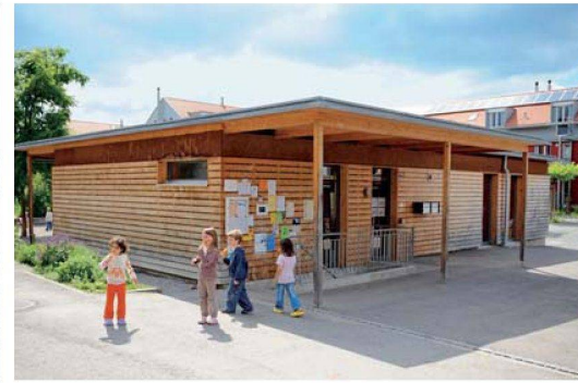
Das Herz der Siedlung: Im Gemeinschaftshaus finden zahlreiche regelmässige Veranstaltungen und spontane Treffen statt.