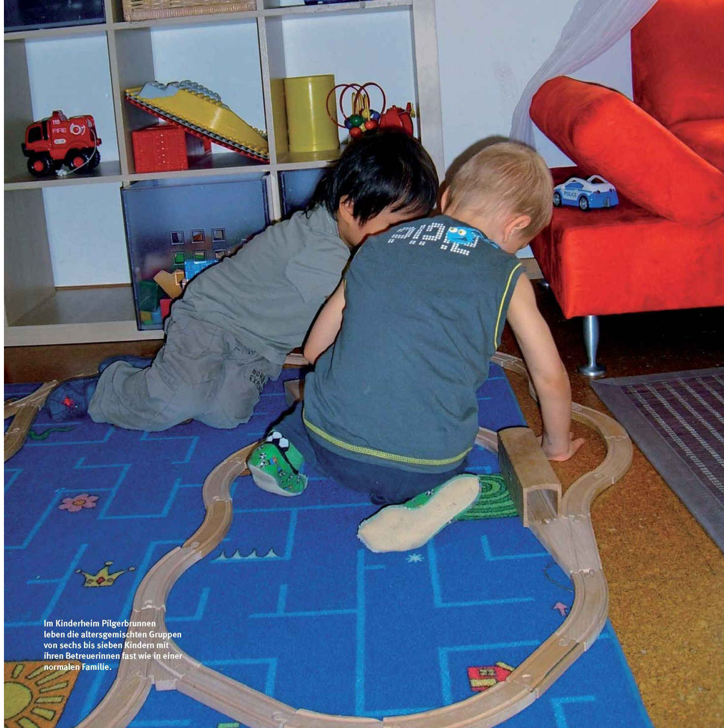
Im Kinderheim Pilgerbrunnen leben die altersgemischten Gruppen von sechs bis sieben Kindern mit ihren Betreuerinnen fast wie in einer normalen Familie.