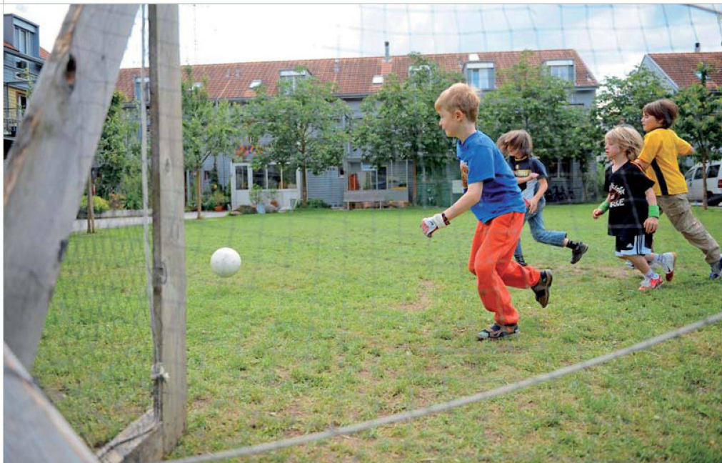
In der Strassweid finden Kinder viel Platz und «Gspänli» zum Spielen.