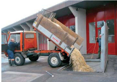
Auch wer auf andere Energieträger wie Gas oder Holzpellets setzt, muss mit Preissteigerungen rechnen.