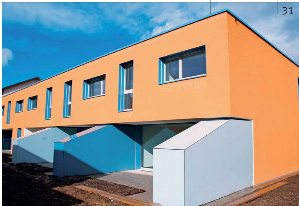
Gute Erfahrungen mit einem zweistufigen TU-Vertrag machte die Vitasana bei ihrer Neubauesiedlung Kronwiesen in Zürich Schwamendingen.

Wenn wir gegenüber einem Kunden ein Werk garantieren, also Kosten, Termine, bauliche Qualität, gehen wir natürlich ein Risiko ein. Dafür müssen wir, ähnlich wie eine Versicherung, eine Risikoprämie verlangen. Diese lag in den letzten Jahren bei