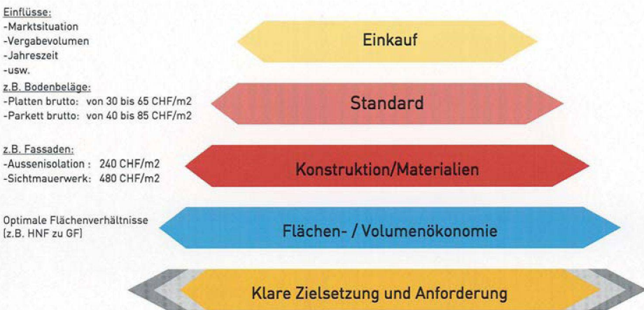
Die «Kostenpyramide» zeigt die verschiedenen Kategorien der beeinflussbaren Kosten und veranschaulicht gleichzeitig die richtige Vorgehensweise von der Grob- in die Feinplanung.