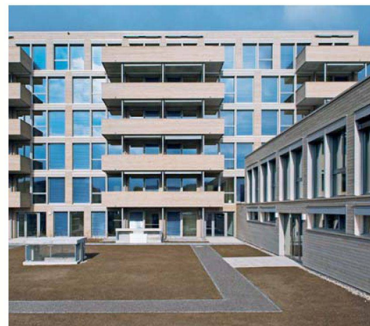
Vorzeigeprojekt Eulachhof in Winterthur: Bei der ersten Nullenergie-Wohnsiedlung der Schweiz war Allreal als TU für Projektentwicklung und Ausführung verantwortlich.

Rahmenbedingungen wie Kostenziele, Wohnungsgrößen, Wohnungsmix, Standards oder Qualitätsansprüche klar formu-