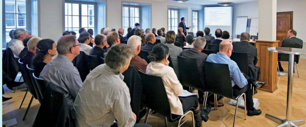
Das jährliche Treffen der Geschäftsführenden im Herbst ist ein beliebter Fixpunkt des SVW-Jahrs.