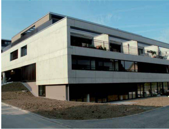
Zeitgemässen Komfort bietet die Ersatzneubausiedlung Büelen der Mieter-Baugenossenschaft Wädenswil.