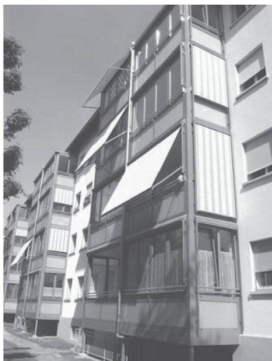
grosser isolierter Wintergarten als Zusatzzimmer nutzbar