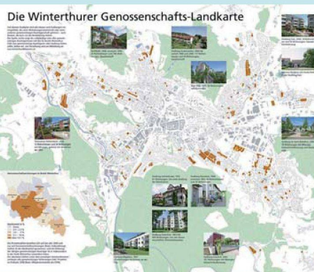
Über 6000 Wohnungen besitzen die gemeinnützigen Bauträger in Winterthur. Auf der neuen Karte sind sie eingezeichnet.

Eine Reihe von Fotos beweisen, dass die Winterthurer Gemeinnützigen in den letzten Jahren mitnichten untätig waren, sondern immer wieder Neubauten erstellt haben. Die Karte wendet sich denn auch nicht nur an die bisherigen und neuen Bewohnerinnen und Bewohner, sondern auch an Politiker, Behörden und Landbesitzer. Ihnen will man vor Augen führen, dass der gemeinnützige Wohnungsbau eine nach-