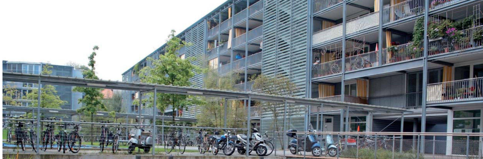
Eine grüne Umgebung mit Fusswegen sowie Spiel- und Sportmöglichkeiten animieren die Bewohner, sich mehr zu bewegen.