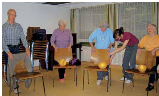
Die Kursteilnehmer trainieren die Oberschenkelmuskulatur.