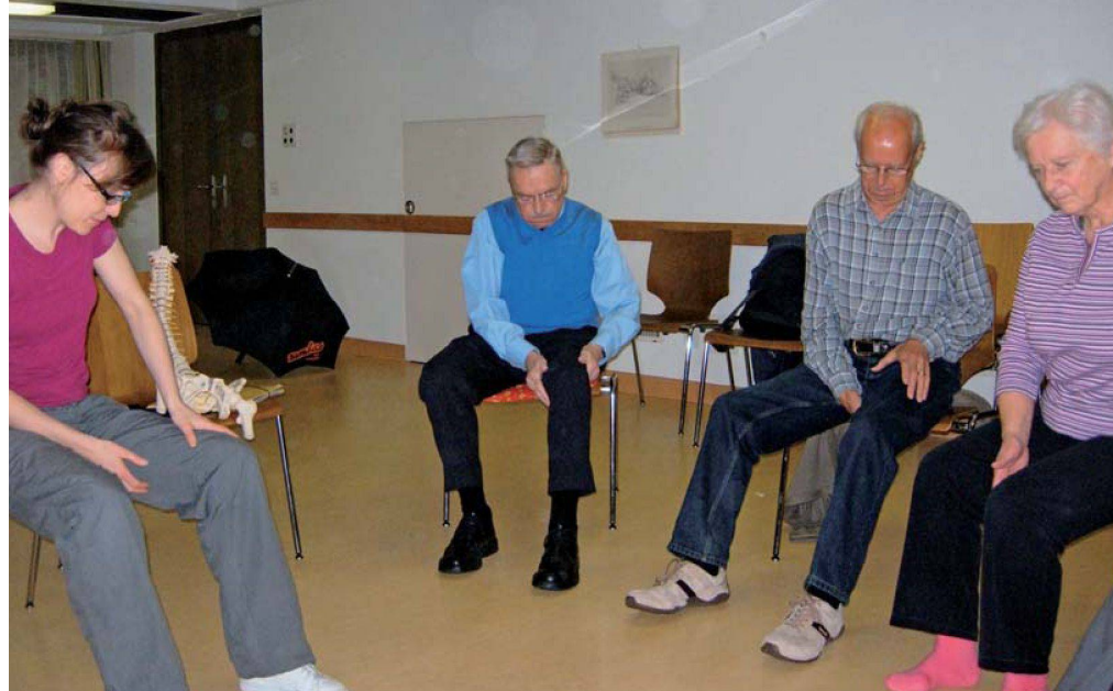
Die Kursleiterin demonstriert und erklärt die Massageübungen.

bei ihrer Arbeit wichtig. Dass die Seniorinnen und Senioren motiviert an den Kursen teilnehmen und diese «durch die eigene Persönlichkeit mitgestalten» freut sie sichtlich.