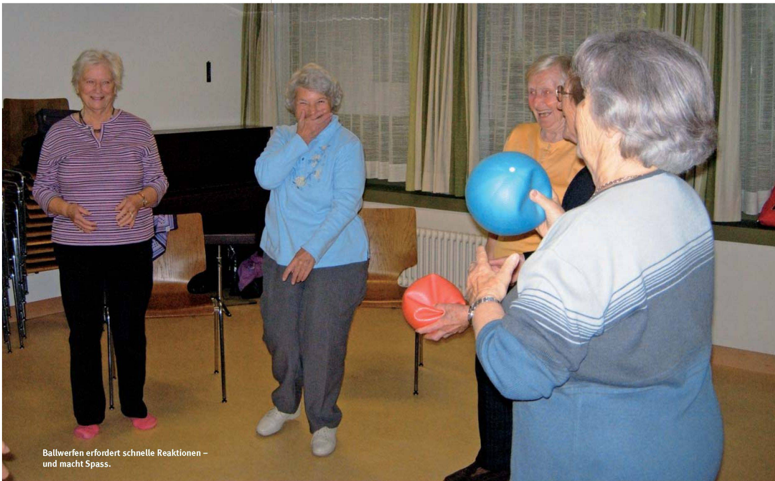
Ballwerfen erfordert schnelle Reaktionen – und macht Spass.

Wer Körper und Geist regelmässig bewegt, bleibt auch im Alter selbständiger. Die Stiftung Alterswohnungen der Stadt Zürich organisiert deshalb Bewegungs- und Gedächtniskurse für ihre Mieter. Das Resultat: Die älteren Menschen können länger unabhängig wohnen. Dass die Trainings zudem Spass machen, durfte wohnen extra bei einem Kursbesuch feststellen.