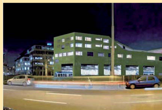
Situationsmodell und Visualisierung des Projekts von Müller Sigrüst Architekten AG. Die Farbgebung ist noch offen. Legende Modell: 1 = Badenerstrasse 2 = Kalkbreitestrasse