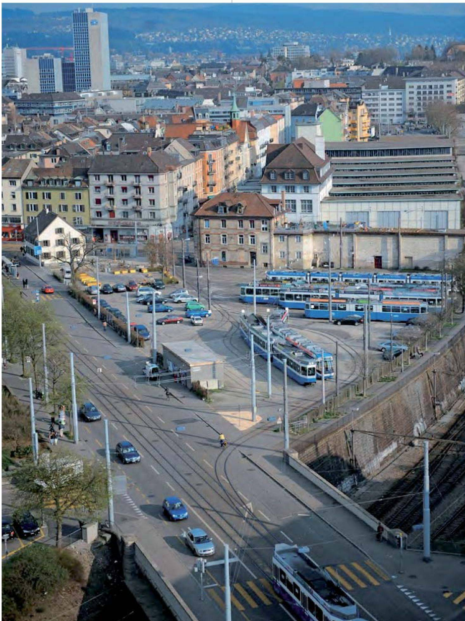
Kalkbreite-Areal: Die zwei Baufelder erstrecken sich zwischen der Badenerstrasse und den Abstellgleisen sowie oberhalb des Tramdepots an der Kalkbreitestrasse (anstelle Backstein-Altbauten). Die Abstellgleise werden überdacht, wodurch die neue Siedlung eine grosse Terrasse erhält. Das ehemalige Restaurant Rosengarten an der Spitze des Dreiecks, das im Besitz der Stadt ist, bleibt erhalten. Die Genossenschaft Kalkbreite betreibt dort einen Quartiertreffpunkt.

schwierig. Sorgt man jedoch dafür, dass grössere Wohnungen tatsächlich von mehreren Personen belegt sind, kommt man relativ einfach auf diesen Schnitt.