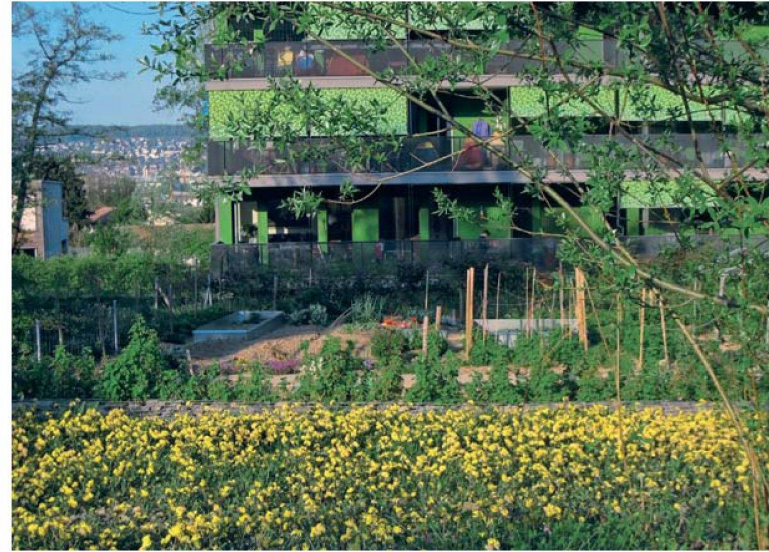
...oder Pflanzgärten für die Bewohner? In der Siedlung Hegianwandweg der Familienheim-Genossenschaft Zürich (FGZ) ist beides möglich.