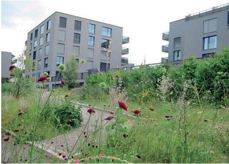
Bunte Magerwiese für die Tierwelt...