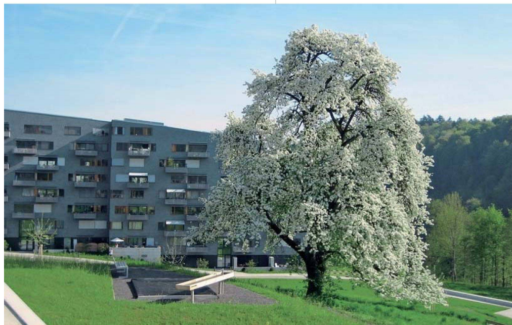
In der Siedlung Vista Verde in Zürich Leimbach setzten die Architekten die Baukörper an den Rand des Grundstücks, sodass die grosszügige Obstwiese erhalten blieb.