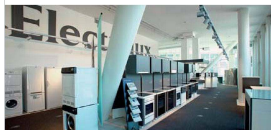
Blick ins neue Kundencenter von Electrolux in Basel.

Herzog & de Meuron entworfenen gläsernen St. Jakob-Turm. Auf rund 400 Quadratmetern können sich Interessierte hier umfassend und kostenlos beraten lassen und fachkundige Informationen über Backöfen und Steamer, Glaskeramik-Kochfelder, Waschmaschinen und Wäschetrockner sowie Kühl- und Gefriergeräte einholen (Birsstrasse 320B, Basel, geöffnet Mo-Fr 9-12 und 13.30-18 Uhr).