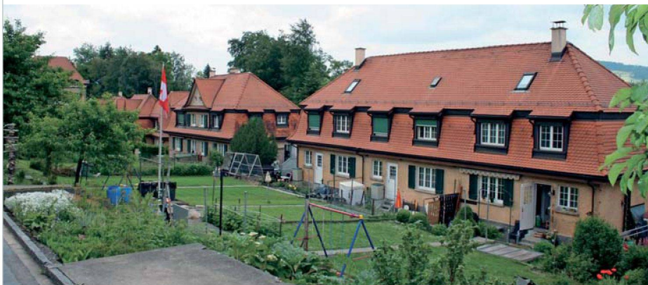
Pioniertat: Die Siedlung Schoren der Eisenbahner-Baugenossenschaft St. Gallen.

Zwar wurden der Eisenbahner-Baugenossenschaft St. Gallen zahllose finanzielle und administrative Hindernisse in den Weg gelegt. Trotzdem konnte sie schon zwei Jahre später mit dem Bau der ersten Wohnungen beginnen. Nach drei Jahren war die Pioniersiedlung Schoren mit 181 Einheiten, zum grössten Teil Einfamilien- und Reihenhäuser, vollendet. Als Vorbild diente die Gartenstadtidee: Die Arbeiterfamilien sollten sich abseits der Zentren in einer natürlichen, grünen Umgebung entfalten können. Damit hatte die EBG St. Gallen den Grundstein für die landesweite Entwicklung