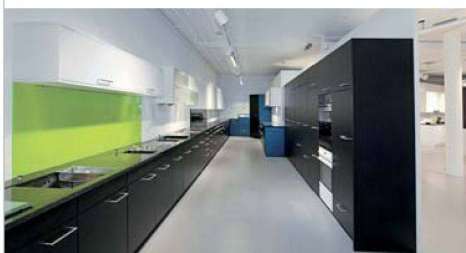
Küchen- und Küchenmöbelwelten präsentiert Piatti in Dietlikon (ZH).

Im Zentrum der Planung stand die wirkungsvolle Präsentation der einzelnen Küchen. Grosszügige Freiflächen erlauben dem Besucher, die Exponate auf sich wirken zu lassen. Gleichzeitig gelang es Greutmann Bolzern, mit typischen Wohnelementen ei-