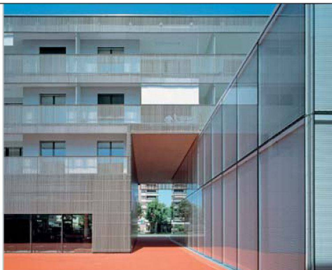
Ein roter Bodenbelag bildet im Hof einen Kontrast zum Grauton der Fassaden.