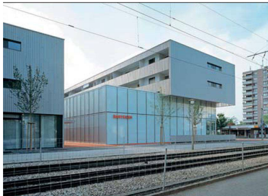
Moderne Architektur und Alterswohnen – kein Widerspruch.