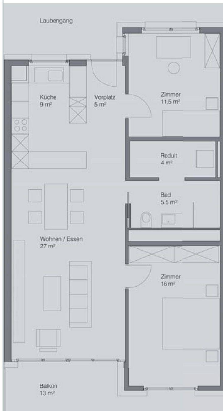
Grundriss einer Dreieinhalbzimmerwohnung.

Platzverhältnisse ermöglichten jedoch keine Holzheizung oder Erdwärmesonden für Wärmepumpenanlagen.» Die Gebäude werden mit Gas geheizt, die Abwärme der Kühlung aus der Raiffeisenbank wird genutzt. Nachhaltigkeit sei auch in einem anderen Sinn verwirklicht, betont Herbst. So etwa dadurch, dass man verdichtet gebaut hat und die Wohnungen optimal an Dienstleistungen und an den öffentlichen Verkehr angeschlossen sind.