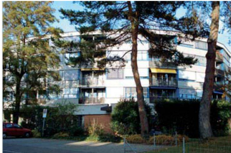
Die Genossenschaft Alterssiedlung Wetzikon hat seit ihrer Gründung im Jahr 1959 immer wieder Neubauten erstellt. Mit Umbauten und Modernisierungen passt sie ihren Bestand stets den Bedürfnissen an.

Die Genossenschaft stellte fest, dass preisgünstiges Wohnen für Seniorinnen und Senioren im Trend war und begann schon bald mit der zweiten Siedlung. Trotz ernsthafter Bemühungen kam erst in den frühen Achtzigerjahren eine dritte Über-