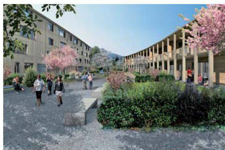
Neuinterpretation der Gartenstadt: Projekt Grünmatt der FGZ, entworfen von Graber Pulver Architekten.

An einer ausserordentlichen Generalversammlung haben die Mitglieder der Familienheim-Genossenschaft Zürich mit grossem Mehr einen Kredit von 85 Millionen Franken für den Ersatzneubau «Grünmatt» genehmigt. Dabei ging es um die Realisierung des Projekts von Graber Pulver Architekten. 2007 hatten die Mitglieder den Projektierungskredit gutgeheissen (vgl. wohnen 9/2007). Die Neubauten ersetzen 64 eingeschossige Reiheneinfamilienhäuser aus dem Jahr 1929. Eine Neuinterpretation der Gartenstadt lautete dabei das Ziel. Die vier geschwungenen Zeilen mit 13 Gebäuden folgen dem Hang und weiten sich an zwei Stellen zu Plätzen aus. 99 der 155 Neubauwohnungen werden einen Garten haben. Weiter sind Individual- und Gästezimmer, Ateliers, eine Pflegewohngruppe, ein Kindergarten, ein Kinderhort sowie ein Gemeinschaftsraum geplant. Eine Viereinhalbzimmerwohnung mit grosser Loggia wird netto etwa auf 2135 Franken monatlich zu stehen kommen.