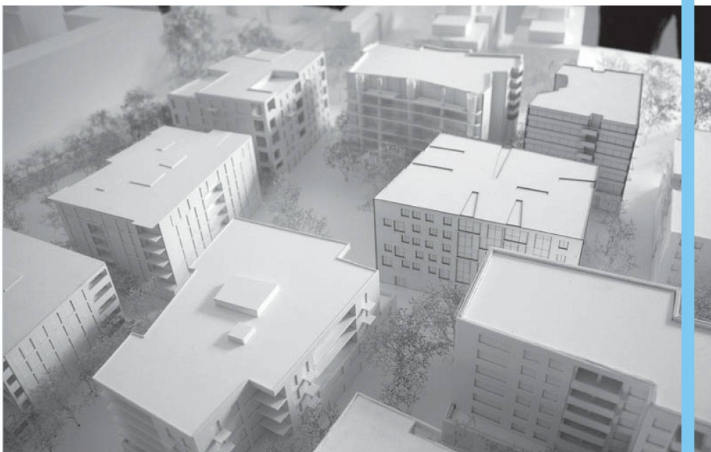
Städtische Dichte, aber auch ein grosser zentraler Platz: Projekt der Baugenossenschaft «mehr als wohnen».

Der im Projekt siegreiche städtebauliche Vorschlag von futurafrosch/Duplex-Architekten setzt grosse Einzelvolumen ein, die einen städtischen Platz bilden und das Quartier über Strassen- und Gassenräume mit den umliegenden Gebieten verweben. Die vier Teams gestalteten je drei bis vier Häuser, die äusserlich unterschiedlich daherkommen werden, sich aber zu einem Ganzen fügen sollen. Die erarbeiteten Woh-