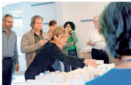
Die vier siegreichen Planerteams überarbeiten gemeinsam mit Vertreterinnen und Vertretern der Baugenossenschaft «mehr als wohnen» die Wettbewerbsresultate.