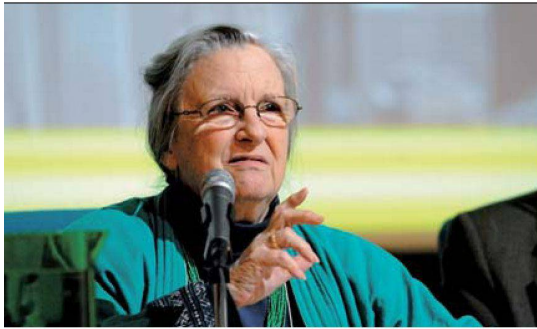
Gemeinschaftseigentum ist nachhaltig: Für ihre Forschungsarbeit erhielt Elinor Ostrom den Wirtschafts-nobelpreis.