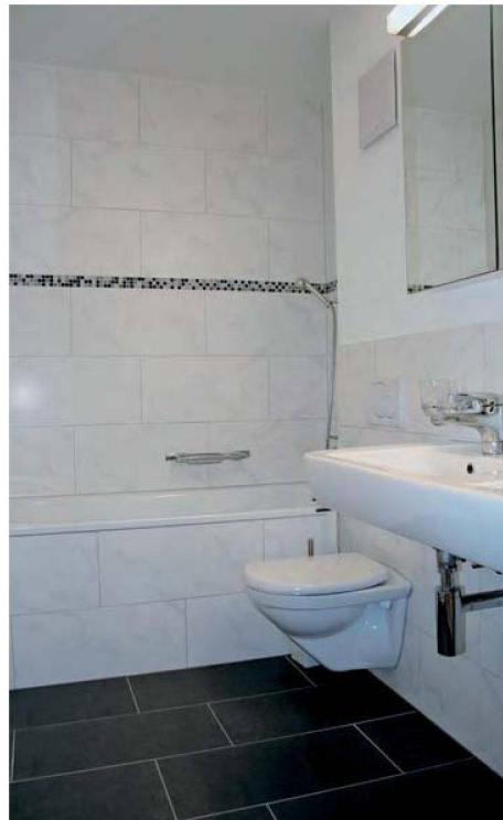
Zeitlose Eleganz: die erneuerten Nasszellen bei der SGK Kloten (Bad/WC sowie Dusche/WC).