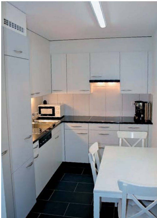
Der dunkle Natursteinboden kontrastiert mit der weissen Küche.