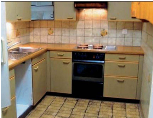
Nicht mehr zeitgemäss: ersetzte Küche aus den 1980er-Jahren.

nieren und der Genossenschaft als Partner und Berater zur Seite zu stehen. Eine gute Lösung, wie der Präsident festhält: «So konnten wir Einfluss nehmen und zum Beispiel bestimmen, dass möglichst viele Betriebe aus der Region berücksichtigt werden.»