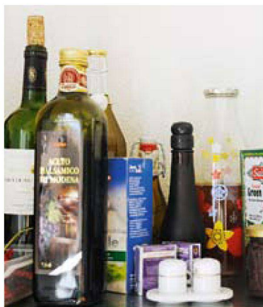
Wohnglück ist: Ordnung in der WG-Küche

mer, gute Belichtung und Besonnung, Ausstattungsqualität und für Familien auch Kinderfreundlichkeit. Weniger wichtig, und das ist überraschend, ist ihnen dafür eine allfällige Aussicht.