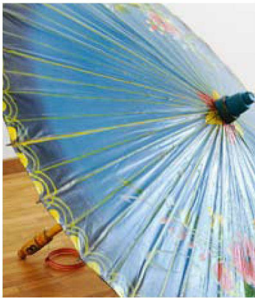
Wohnglück ist: Erinnerungen an schöne Reisen