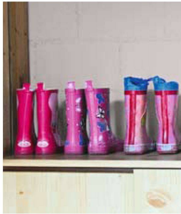
Wohnglück ist: Platz für die Drillinge haben