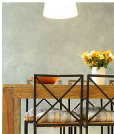
Wohnglück ist: die Wohnung stilvoll dekorieren

Ein erstaunliches Ergebnis ergibt sich, wenn man die verschiedenen Siedlungen vergleicht. Dann kommt man zum paradox anmutenden Resultat, dass die Bewohner in kostengünstigen, älteren Siedlungen mit geringem Ausbaustandard zufriedener sind als diejenigen in modernen Neubausiedlungen. Die besten Zufriedenheitswerte erzielte eine Siedlung aus den Vierzigerjahren, die an einer lauten Strasse liegt und kleinräumige Grundrisse bietet. Erklären lässt sich dies zum einen mit einer unterschiedlichen Anspruchshaltung: Die architektonisch herausragenden und luxuriös ausgestatteten Neubausiedlungen sind sehr teuer – und die Bewohner entsprechend kritisch und weniger bereit, gewisse Mängel in Kauf zu nehmen. Gleichzeitig bewerteten die Mieter in der eher einfachen Siedlung den Service der Verwaltung und des Hauswirts sehr positiv. Auch die ABZ, die an zweiter Stelle liegt, schnitt diesbezüglich sehr gut ab. «Das sind Aspekte, die viel ausmachen», schliessen die Forscher. «Man spürt, wenn sich der Eigentümer Mühe gibt.» Umgekehrt wird auch ne-