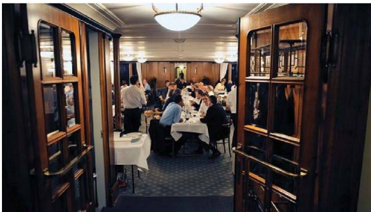
Stimmungsvolle abendliche Schifffahrt