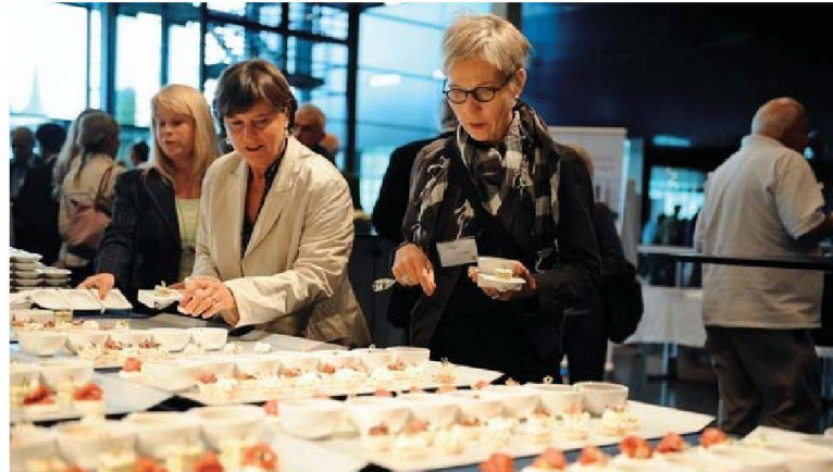
Nicht zu kurz kam der kulinarische Teil.