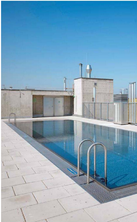
Sozialwohnungsbau mit Swimmingpool: auch für Wien ungewöhnlich.

mit herausragenden, jüngeren Architektenteams gesucht.