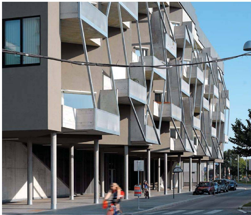
Die Einheiten im Erdgeschoss können als Wohnateliers oder Geschäftslokale genutzt werden – und werden so dereinst zur Belebung des Quartiers beitragen.

bewusst einen engagierten Bauherrn aus, der bereit war, ihr Projekt auch ideell mitzutragen. «Bereits das Modell war atemberaubend», erinnert sich der Direktor der Baugenossenschaft, «nie hätte ich gedacht, dass es um die zulässigen Mittel zu errichten wäre.»