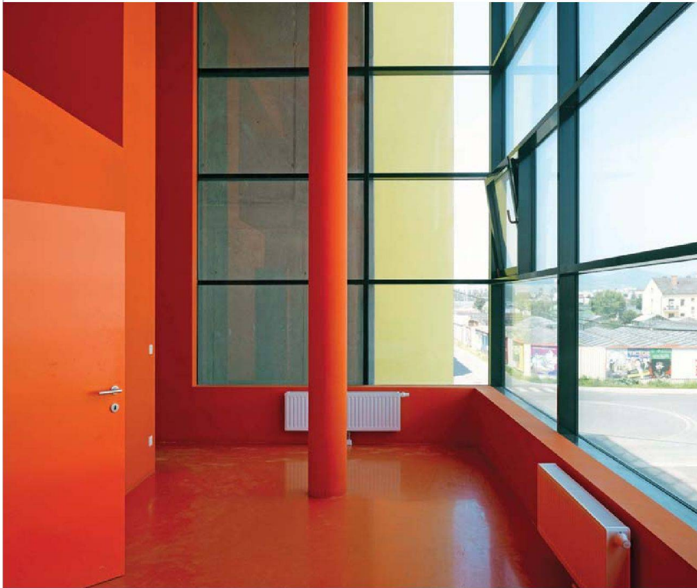
Luftige Laubengänge erschliessen die Wohnungen.

Was von der Architekturkritik einhellig für herausragend befunden wird, entspricht nicht immer den Bedürfnissen im eigentlichen Kernsegment des sozialen Wohnbaus. Tatsächlich wird mit diesen Wohntypen auch vermehrt eine Klientel aus dem städtischen Mittelstand angesprochen, die in der Lage ist, die Mietwohnungen später zu kaufen. Dass sich dies von den ursprünglichen Zielen des «sozialen» Wohnbaus immer mehr wegbewegt, entspricht einer heutigen