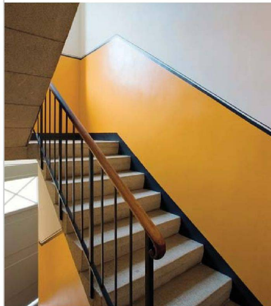
Auch die Treppenhäuser erneuerte man originalgetreu.