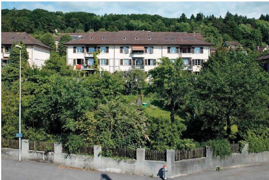
Architekt Eduard Lanz erstellte die Siedlung Sonnhalde nach der Gartenstadt-Philosophie.