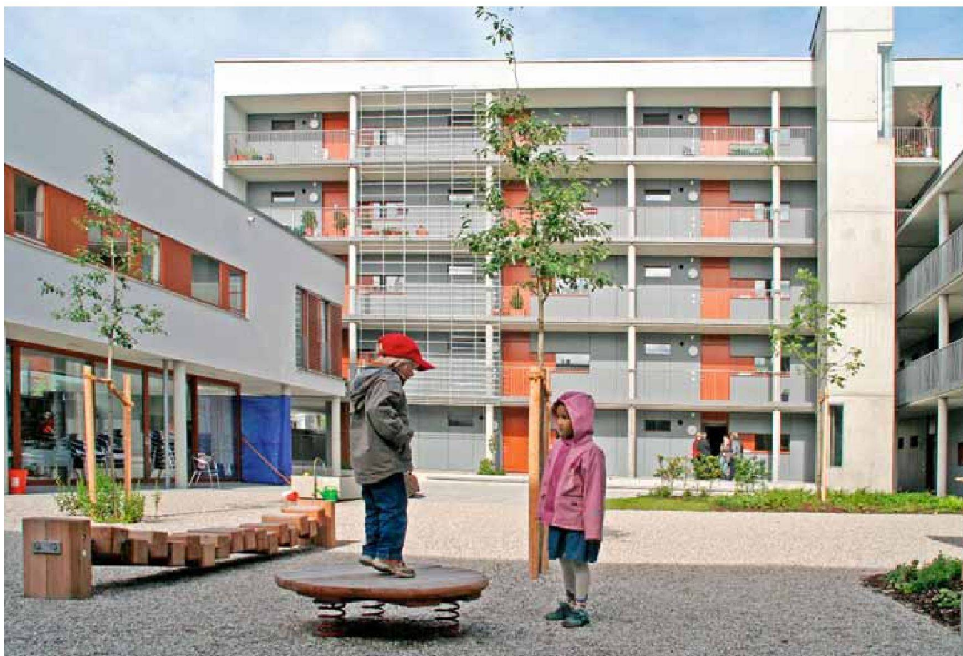
Kinder wohnen nur wenige in der Siedlung. Für Alleinerziehende ist wohl das nötige Eigenkapital zu hoch.

Dass alleinstehende Frauen sich zusammenschliessen, ist keine neue Erfindung. Schon im Mittelalter gründeten ehelose Frauen Wohngemeinschaften: In den so genannten Beginenhöfen lebten sie in einer religiösen Gemeinschaft zusammen. Diese Idee wurde später von der Frauenbewegung aufgegriffen, diese Beginenhöfe hatten allerdings keinen christlichen Hintergrund mehr. Zu Beginn des 20. Jahrhunderts entstanden in Berlin und Frankfurt, aber auch in der Schweiz eigentliche Frauenwohnhäuser. In Zürich etwa gründete eine Gruppe von Frauen aus