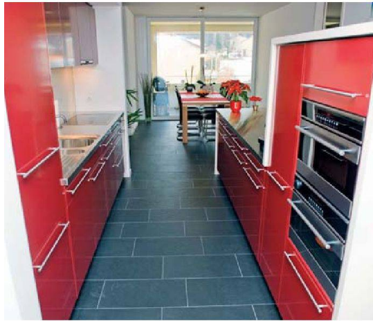
Die Stahlküche verfügt über einen Kombibackofen und einen Steamer.

eine Komfortlüftung mit Wärmerückgewinnung, sondern auch über eine Pelletheizung, die zu Spitzenzeiten von einer Gasheizung unterstützt wird. Eine Solaranlage unterstützt die Aufbereitung des Warmwassers. Viel Wert legte die Genossenschaft auf den Erhalt der grosszügigen Grünflächen, ein Anliegen, das auch die Mieter einbrachten. Gleichzeitig erreicht sie, auch dies ein Postulat der Nachhaltigkeit, eine erstaunliche Verdichtung. War bisher 19 Prozent der Siedlungsfläche überbaut, wird es nach Abschluss der zweiten Etappe nur wenig mehr sein, nämlich 24 Prozent. Trotzdem verdoppelt sich die Nutzfläche in der zweiten Etappe, während sie sich in der ersten gar verdreifacht hat.