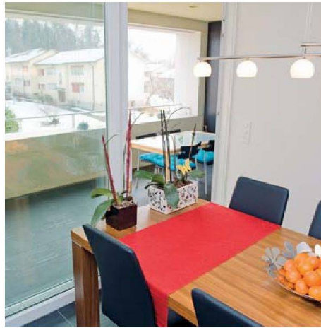
Die Loggien sind eigentliche Aussenzimmer. Durch die Fenster sind die Altbauten der zweiten Etappe ersichtlich, die nun ersetzt werden.

Einen dicken Wermutstropfen musste die Genossenschaft allerdings einstecken. Verschiedene Faktoren wie die hohe Bauteuerung oder Mehrkosten wegen neuer Vorschriften brachten das Budget aus dem Lot. Dies bedeutete, dass das erklärte Ziel, die Viereinhalbzimmerwohnung für weniger als 2000 Franken Monatsmiete anzubieten,