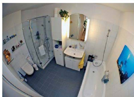
Luxus: Die Bäder in den Zweieinhalb- und Dreizimmerwohnungen sind mit Dusche und Badewanne ausgestattet.