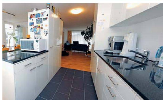
In der neuen Dreieinhalbzimmerwohnung hat der Genossenschaftspräsident 20 Quadratmeter mehr Platz als zuvor im Vierzimmer-Reihenhäuschen.