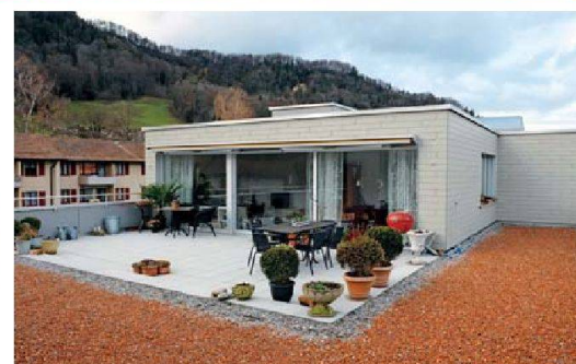
Die Attikawohnungen mit Riesenterrasse und Panorama sind zwar teurer, waren aber am schnellsten vermietet.