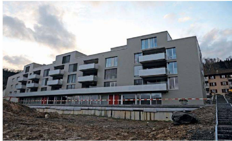
Ein moderner Kontrast zu den Altbauten im Quartier: Der Neubau mit der silbergrau geschindelten Fassade, den knallroten Hauseingängen und der durch die Attikageschosse strukturierten Optik.

später das vorgeschlagene Bauprojekt mit grossem Mehr an. Nicht zuletzt weil der Vorstand versprach: «Niemand wird wegen der Erneuerung die Kleeweid verlassen müssen.» Dass dieses Versprechen tatsächlich eingehalten werden konnte, dafür sorgte eine langfristige und etappierte Planung. Nach dem ersten Generalversammlungsbeschluss im Jahr 2004 rückten erst Ende 2007 die Bagger an. Knapp zwei Jahre später, im Herbst 2009, konnten die Mieter in die fünf Häuser der ersten Etappe einziehen. Neben den drei Ersatzbauten erstellte die Genossenschaft auch zwei zusätzliche Häuser. Dies gab Platz für Rochaden: Zehn Familien aus den noch verbleibenden vier Altbauten nutzten die Gelegenheit, in den Neubau zu zügeln. Sieben Parteien wagten den Schritt vom Reihenhaus in die Neubauwohnung. Bevor Anfang 2010 die letzten vier Gebäude weichen müssen, finden nun einige Familien in den frei gewordenen Reihenhäusern ein neues Zuhause. Und ein Teil der vorwiegend älteren Genossenschaftlerinnen und Genossenschaftler, die sich ursprünglich am meisten gegen die Erneuerung gewehrt hatten, waren letztlich gar nicht mehr davon betroffen: einige verstarben in der Zwischenzeit oder zügelten in Alterswohnungen beziehungsweise ins Altersheim.