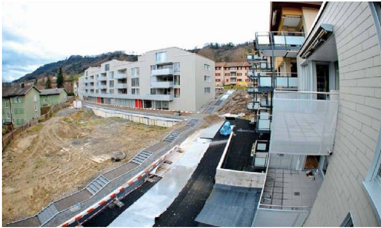
Die Neubauten werden, wenn Ende 2011 beide Etappen stehen, ein Dreieck um einen grosszügigen, parkähnlichen Innenhof aufspannen. Links im Bild die noch verbleibenden Altbauten, am oberen rechten Bildrand die beiden Gebäude aus den 60er-Jahren, die die Architekten elegant in das Ensemble miteinbezogen haben.