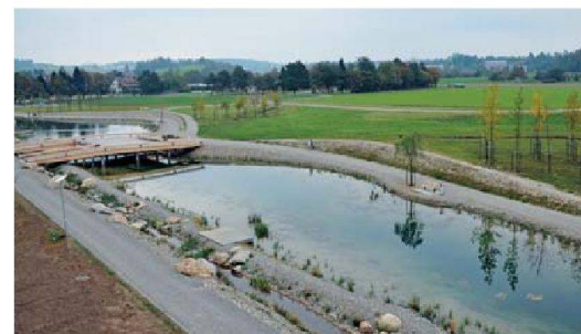
Unverbaubare Lage: die Wohnungen bieten Ausblick auf den Griespark und die Alpen.

Das 7127 Quadratmeter grosse Stück Land erwarb die Bahoge von der Gemeinde Volketswil. Mit dem Erlös des Parzellenverkaufs konnte diese teilweise den zehn Hektaren grossen Erholungs- und Freizeitpark