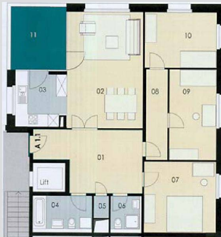
Jeder Wohnung ist eine Farbe zugeordnet, die schon an der Türe und Loggia erkennbar ist und sich in Details im Wohnungssinnern (z. B. im Bad) fortsetzt.

Zeitplan konnten trotzdem eingehalten werden. Dafür sorgte eine Baukommission aus Architekt und Vertretern der Bahoge. Realisiert wurden die Bauarbeiten nicht mit einem GU, sondern mit Einzelunternehmen. «Damit sind wir sehr gut gefahren», erklärt Erich Rimml. Die Preisexplosion beim Stahl Anfang 2008 sorgte zunächst für einige Engpässe, dies konnte aber durch eine strikte Kostenkontrolle aufgefangen werden. Die Siedlung kann durchaus mit den Minergieanforderungen mithalten. Aus Kostengründen verzichtete man aber auf eine Komfortlüftung. Die Neubauten decken ihren Energiebedarf mit einer Holzpellettheizung sowie Sonnenkollektoren auf den Flachdächern, die das Warmwasser für die Wohnungen liefern und die Heizung unterstützen.