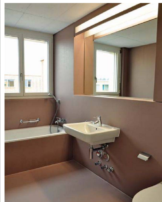
Die Badezimmerausstattung kann durchaus mit dem Eigentums- oder Hotelstandard mithalten.