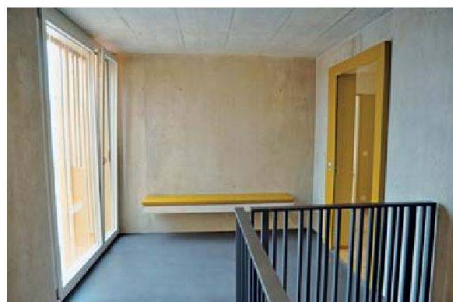
Überraschend hoher Ausbaustandard auch im Treppenhaus (mit Sitzbank): Jede Wohnung hat eine eigene Farbe, die sich im Wohnungsinnern fortsetzt.

Hotels. Auch die auf Flexibilität angelegten Wohnungsgrundrisse zeugen von der Weitsicht der Bauherren.