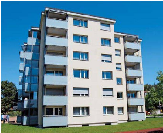
Als Pilotprojekt setzte die ASIG Wohngemeinschaft bei der Fassadenrenovierung ihrer Siedlung Wieslacher in Zürich Witikon das System «Aqua Pura Vision» ein. Die Bilanz nach drei Jahren ist positiv.

bewähre, fügt er hinzu. Glatte Oberflächen zum Beispiel verschmutzen weniger und bieten damit einen schlechteren Nährboden für Bewuchs. Hemmend wirkt auch Kreidung, da damit die Bewuchsgrundlage quasi wegbröckelt.