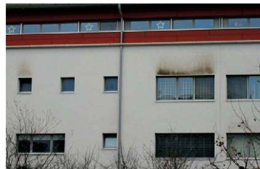
Fehlende oder kleine Dachvorsprünge begünstigen die Algenbildung. Oft findet sich Algenbefall auch oberhalb von Kipfenstern, weil die warme Luft auf der Fassade kondensiert.