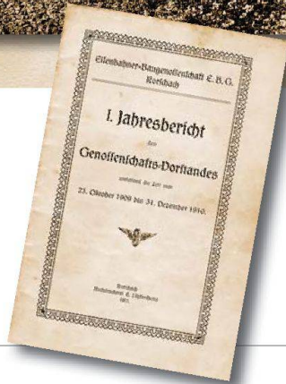
Vor hundert Jahren entstanden die ersten Eisenbahner-Baugenossenschaften. Im Bild frühe Siedlungen von BEP, EBG St. Gallen, EBG Rorschach (mit erstem Jahresbericht) und EBG Luzern.