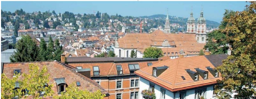
Panoramablick von einer der oberen Wohnungen.