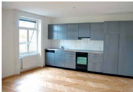
Der Fischgratparkett im Wohnbereich reicht bis an die Küchenzeile heran.