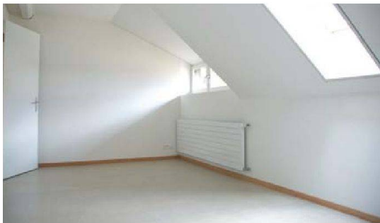
Einblick in eine Dachwohnung mit geschliffenem Betonboden.