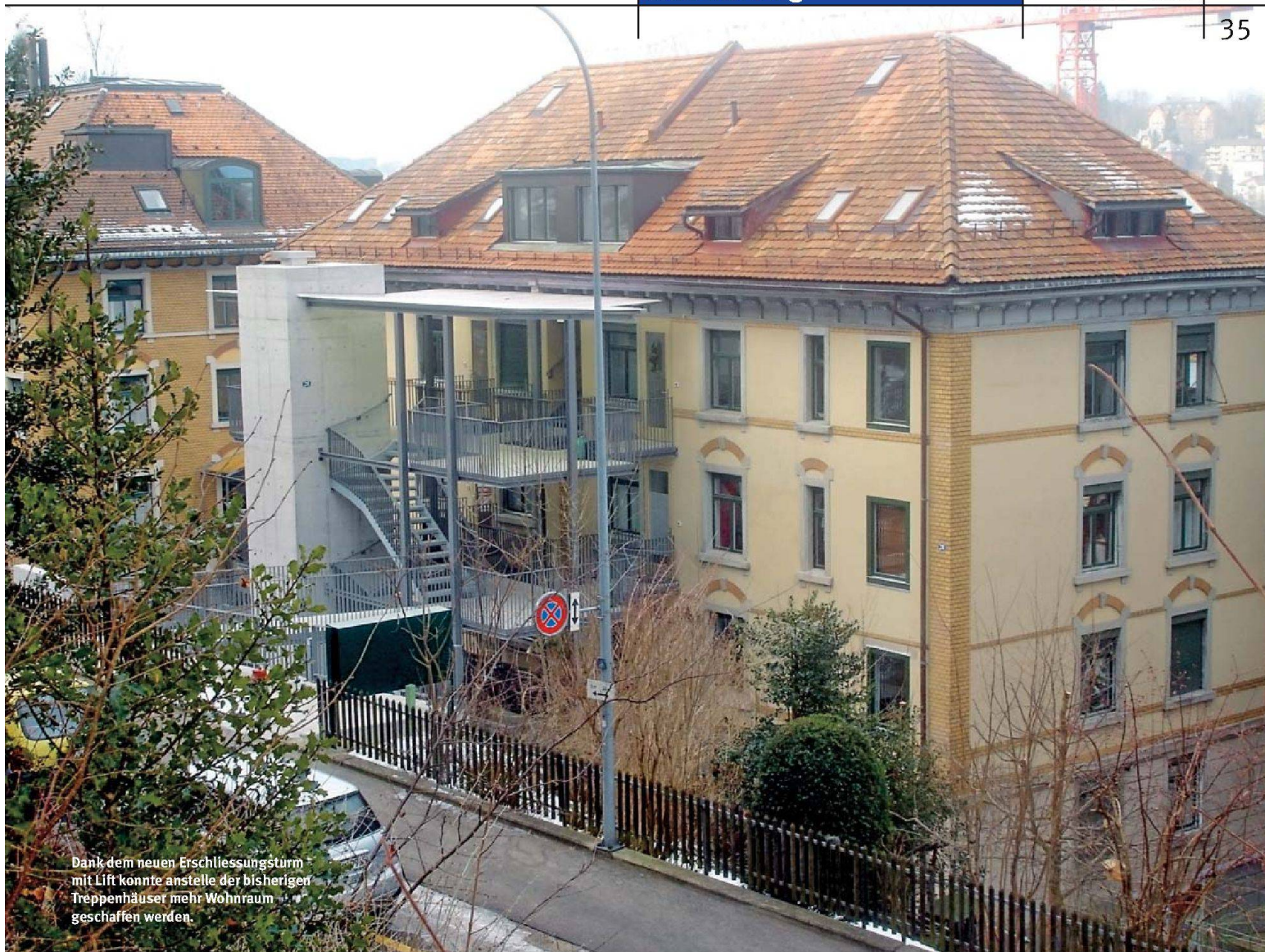
Dank dem neuen Erschliessungsturm mit Lift konnte anstelle der bisherigen Treppenhäuser mehr Wohnraum geschaffen werden.

GBS Gemeinnützige Baugenossenschaft St. Gallen baut ehemaliges Durchgangsheim um