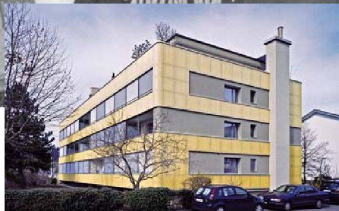
Gesamtsanierung Bifangstrasse 1+3, 4153 Reinach BL