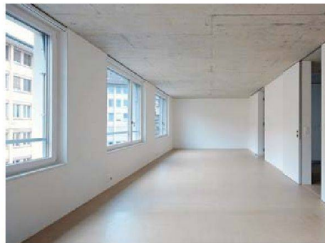
Sesam schliesse dich: der hintere Raum kann wahlweise abgetrennt (links) oder offen gelassen werden.