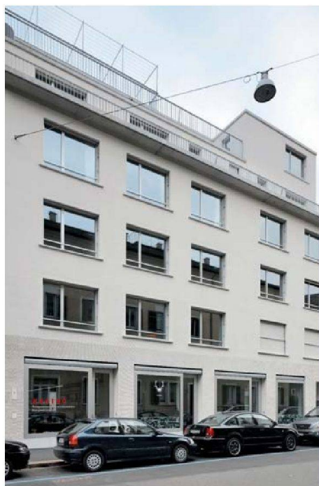
Von aussen fügt sich der Neubau diskret in die Baulücke ein. Im Erdgeschoss bezog die Geschäftsstelle der Wogeno Zürich neue Büros.