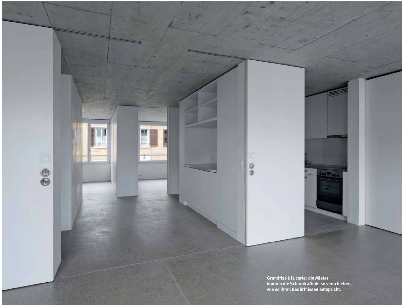
Grundriss à la carte: die Mieter können die Schrankwände so verschieben, wie es ihren Bedürfnissen entspricht.

Wogeno Zürich erstellt Ersatzneubau mit sehr flexiblen Grundrissen