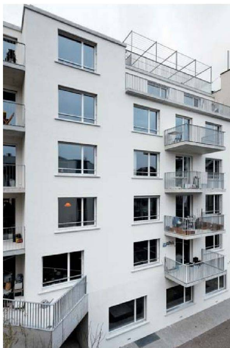
Zur Hofseite verfügen die Wohnungen über kleine Balkone beziehungsweise Dachterrassen.

Ökologisch und natürlich sind auch die Materialien im Innenausbau: Die Böden bedeckt ein sandbeige melierter Anhydritbelag, auf die Wände wurde ungestrichene biologische Kalkputzglätte aufgetragen. Ähnlich dem japanischen Vorbild strahlen die Räume dadurch eine schlichte Klarheit und gleichzeitig eine natürliche Behaglichkeit aus, wie ein kurzer Augenschein in einer der Wohnungen bestätigt. Der Architekt sieht sich neugierig um. Er deutet auf die Bücherwand: Dahinter verbirgt sich – für das Laienauge nicht bemerkbar – eine verschiebbare Wand. Genau so hat er sich das vorgestellt. Die Wohnungen wurden vor einem halben Jahr bezogen und tatsächlich hat nun jede einen ganz anderen Grundriss. Bisher hat sich das mobile System gut bewährt: Nur in einem Fall musste die Genossenschaft die Schalldämmung mit einer Filzverkleidung etwas verbessern. Die Schiebewände sind zwar nicht wie in Japan aus Pergament, sondern massiv geschreinert, kommen aber bezüglich Schallschutz nicht an eine feste Wand heran. Die Wogeno will nun beobachten, welche Erfahrungen die Mieter längerfristig machen. Grundsätzlich aber müssen diese sich bewusst sein, dass das Wohngefühl mit verschiebbaren Schrankwänden anders ist: «Man kann nicht alles haben.»