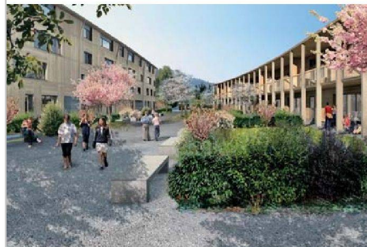
Beim Ersatzneubau Grünmatt arbeitet die FGZ erstmals mit dem Kostengarantiemodell.