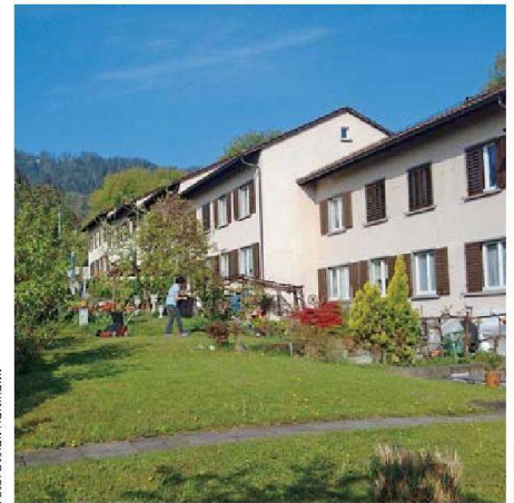
Die FGZ-Reihenhäuser an der Arbestalstrasse im Zürcher Friesenberg: energetische Prüfung vor der Sanierung.