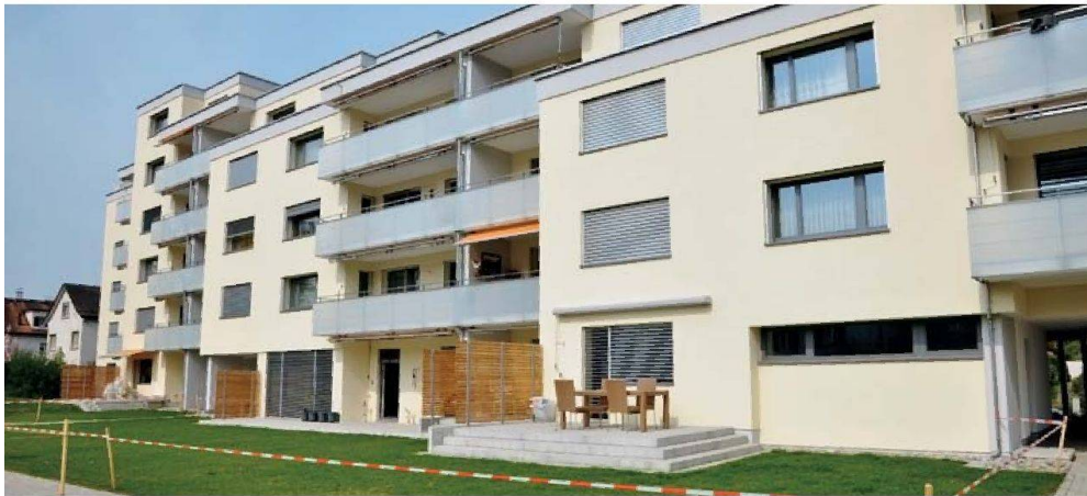
2009 sanierte die ASIG ihre Siedlungen Mattacker I und II in Zürich Seebach nach Minergie. Mit der Energieetikette wollte die Genossenschaft unter anderem überprüfen, ob die Energieziele erreicht worden waren.