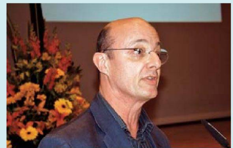
Ehrengast Louis Schelbert, SVW-Präsident und Nationalrat, orientierte über die jüngsten Entwicklungen der Wohnbaupolitik.