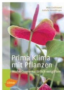
Wohnräume natürlich entgiften