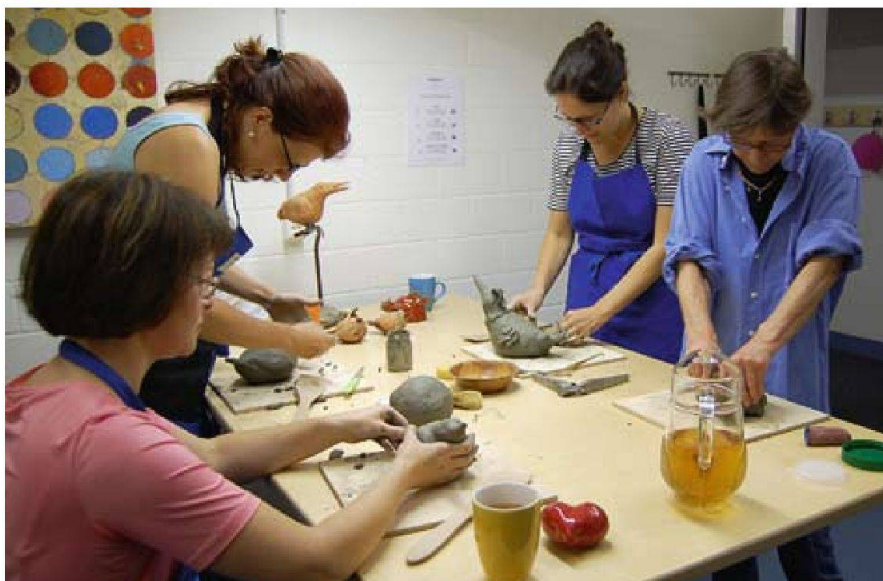
Töpferwerkstatt im Keller: BG Sonnengarten.