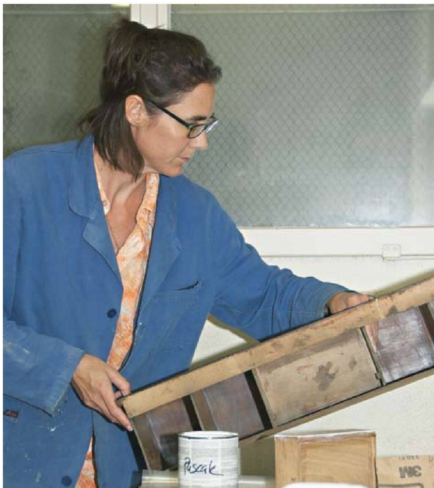
Unter fachkundiger Anleitung traut man sich auch an aufwändigere Möbelrestaurationen heran.