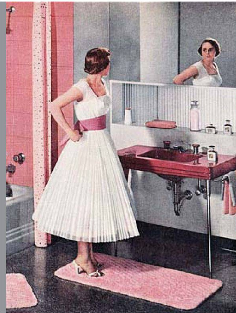
In den Fünfzigerjahren versuchte man die durch die serielle Fertigung entstandene Gleichförmigkeit mit bunten Plättli und Apparaten zu durchbrechen.

insbesondere in den Städten den Umgang mit Wasser. Hygiene wurde zum Garant nicht nur für körperliche Gesundheit, sondern auch für moralische Integrität. Einer reinlichen Person mit sauberen Kleidern attestierte man bis heute Anstand und Rechtschaffenheit. Oberstes Ziel der städtischen Behörden und Grund für die aufwändigen infrastrukturellen Arbeiten, im Zuge derer schliesslich auch die ersten Wohnhäuser mit Druckleitungen ausgerüstet wurden, war denn auch die Schaffung hygienischer Wohnverhältnisse. Wasser floss nun plötzlich schier unbegrenzt. Die parallel entstehenden Gas-Durchlauferhitzer und Zentralheizungen wärmten nicht nur das Wasser und die Räumlichkeiten, sondern auch bereitliegende Handtücher oder Bademäntel.