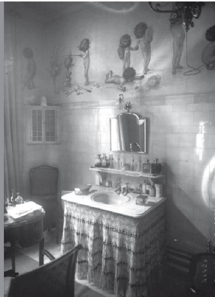
Bis weit ins 18. Jahrhundert beschränkte sich die tägliche Körperpflege im abgedunkelten «Cabinet de Toilette» auf das Auftragen von Puder und Parfum.