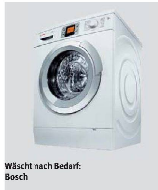
Wäscht nach Bedarf: Bosch