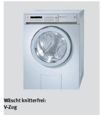
Wäscht knitterfrei: V-Zug