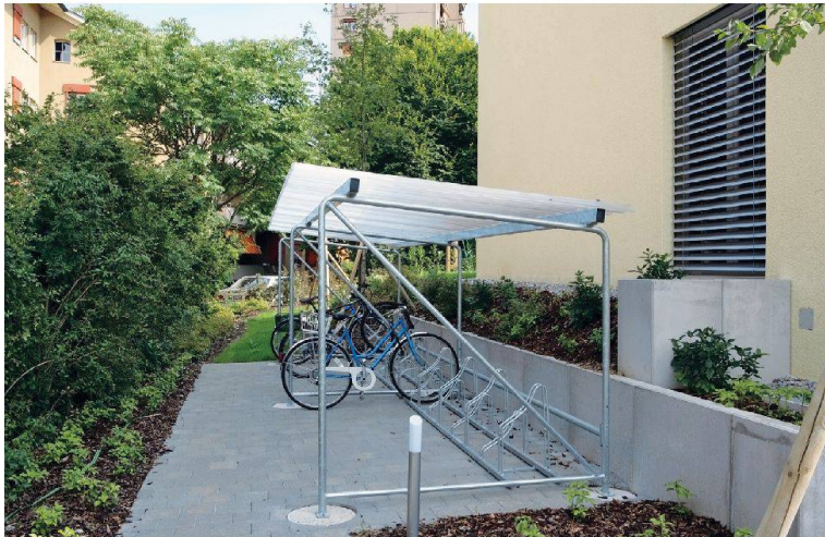
Dieser einfache Unterstand ist für schmale Durchgänge geeignet, da er besonders platzsparend ist (Modell Velopa).