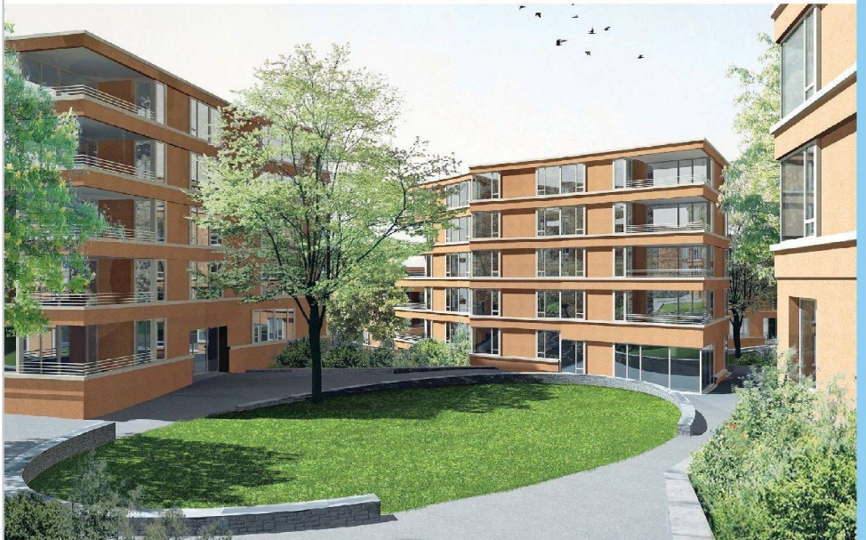
Eine zurückhaltende Architektur mit viel Freiraum zeichnet das Projekt von BS + EMI aus.

Die 163 neuen Wohnungen, davon knapp die Hälfte für Familien, sind alle nach denselben Regeln aufgebaut. In den zusammenhängenden Wohn- und Essbereichen sind leicht unregelmässige Geometrien anzutreffen, während die einzelnen Zimmer konventionell im rechten Winkel organisiert sind. 20 Separatzimmer, Gemeinschaftsräume, Ateliers und Kindertagesstätten runden das Angebot ab. Auch eine Hausgemeinschaft für ältere Menschen ist vorgesehen. Der innere Siedlungsraum wird ein vielfältiges Angebot an Spielplätzen und Treffpunkten bieten. Eine 4½-Zimmer-Wohnung mit 103 Quadratmetern Wohnfläche soll im Durchschnitt weniger als 1700 Franken monatlich kosten – Nebenkosten inklusive. Bei der Vergabe erhalten die bisherigen Mieter den Vorzug. Die Gesamtinvestition beträgt rund 58 Millionen Franken. Die erste Etappe soll 2014 bezugsbereit sein.