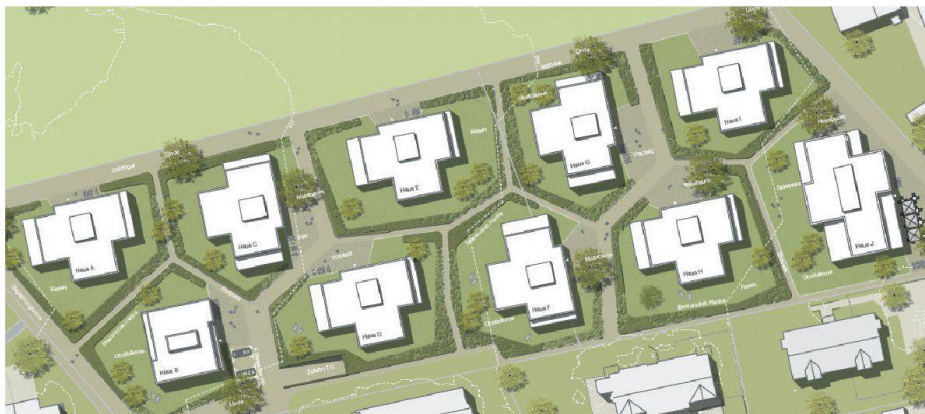
Eine Überbauung, die sich den dörflichen Strukturen anpasst: Projekt von Niedermann Sigg Schwendener Architekten AG für die Neubausiedlung Törlenmatt in Hausen am Albis.