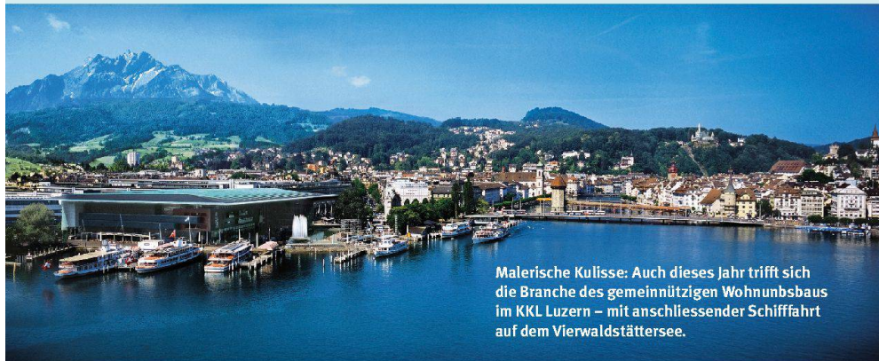
Malerische Kulisse: Auch dieses Jahr trifft sich die Branche des gemeinnützigen Wohnungsbaus im KKL Luzern – mit anschließender Schifffahrt auf dem Vierwaldstättersee.