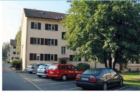
Eine Sanierung der Altbauten lohnt sich nicht mehr.