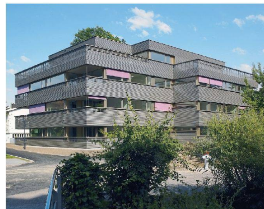
Attraktiver Holz-Neubau der Gawo.

Die Genossenschaft für Alterswohnungen Oberrieden (Gawo) hat ihren Bestand um ein Mehrfamilienhaus mit 14 attraktiven Einheiten erweitert. Der Neubau am Spielhofweg 11 liegt äusserst zentral, nämlich direkt neben dem Gemeindehaus. Da Befragungen von Senioren ergeben hatten, dass besonders grössere Alterswohnungen gefragt sind, entstanden ausschliesslich Zweieinhalb- und Dreieinhalbzimmerwohnungen – dies auch als Ergänzung zum übrigen Bestand der Genossenschaft. Die Mieten der Etagenwohnungen bewegen sich zwischen 1750 und 2000 Franken. Der Holzbau, entworfen vom Büro Frei & Ehrensperger Architekten Zürich, entspricht dem Minergiestandard. Die Baukosten betragen 7,5 Millionen Franken.