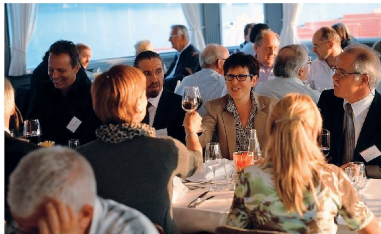
Die Tagung bot viel Raum für Diskussion und zwanglose Plauderei. Auch die Sponsoren hatten ihren Auftritt. Und am Abend gings auf den See.