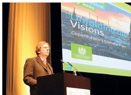
Michael Braungart: mag keinen Müll.