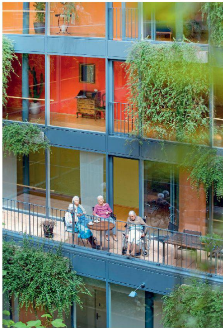
Ort der Begegnung: Age-Preis Träger Alters- und Pflegeheim Bachgraben in Allschwil.