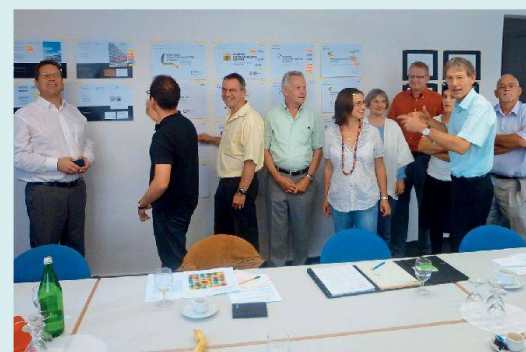
Am Workshop der Regionalverbände wurde rege über die verschiedenen Designvorschläge diskutiert.

Bekanntlich wird der SVW künftig nicht mehr «Schweizerischer Verband für Wohnungswesen», sondern «Wohnbaugenossenschaften Schweiz – Verband der gemeinnützigen Wohnbauträger» heissen. Dies nun schon früher als geplant: An ihrer Versammlung vom Juni 2011 beschlossen die Delegierten, mit der Umfirmierung nicht wie ursprünglich vorgesehen bis zu einem allfälligen Umzug der Geschäftsstelle zuzuwarten, sondern den neuen Namen bereits im Jahr 2012 einzuführen. Dazu gehört natürlich auch ein neuer visueller Auftritt. Inzwischen haben deshalb verschiedene Grafikbüros im Rahmen eines Wettbewerbs Vorschläge entwickelt, wie ein solches Corporate Design aussehen könnte. An einem Workshop diskutierten die Vertreter der Regionalverbände Ende September die sehr unterschiedlichen Designvorschläge. Der Dachverband und die Regionalverbände sehen diesen Prozess als einmalige Chance, einen einheitlichen Auftritt für den Verband entwickeln zu können. Gemeinsam sind wir