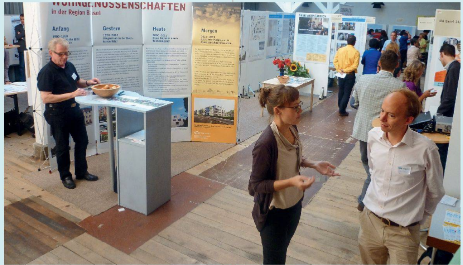
350 Besucherinnen und Besucher informierten sich an 25 Ständen und sechs Vorträgen über neue Wohnprojekte in der Region Basel.

Der SVW Nordwestschweiz präsentierte an seinem Stand neben einem historischen Abriss über Wohngenossenschaften auch aktuelle Wohnbauprojekte. So zum Beispiel den Neubau der Wohngenossenschaft Hegeheimerstrasse mit 20 Wohnungen, die soeben fertiggestellt wurden und ganz ohne Werbung schon fast alle vermietet sind. Auch in Riehen wird gebaut: Der WGN wird hier in den nächsten Jahren die Wohnüberbauung Kohlistieg mit 90 Wohnungen erstellen. Spannend auch das Projekt für ein Studentenzentrum in Universitätsnähe – ein Thema, das in Basel in den letzten Jahren etwas vernachlässigt wurde. Nun liegt es an der Basler Regierung, diesem Projekt,