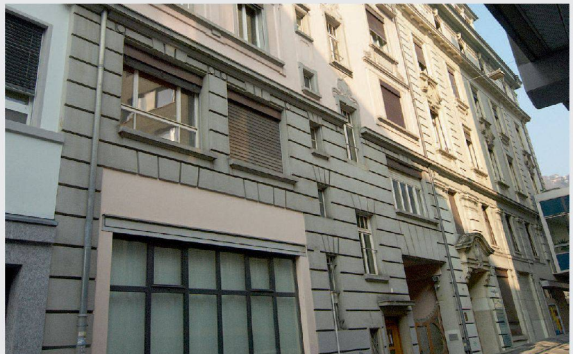
Wohnraum für Benachteiligte: Verein Casanostra

baut worden waren. Nach dem Kauf wird Casanostra in den nächsten Jahren die notwendigen Sanierungsmassnahmen für den nächsten Lebenszyklus der Liegenschaft in die Wege leiten. Die Stiftung Solidaritätsfonds von Wohnbaugenossenschaften Schweiz gewährt dem Verein Casanostra zur Mitfinanzierung der Erwerbs- und Renovationskosten ein zinsgünstiges und rückzahlbares Darlehen in Höhe von 390 000 Franken.