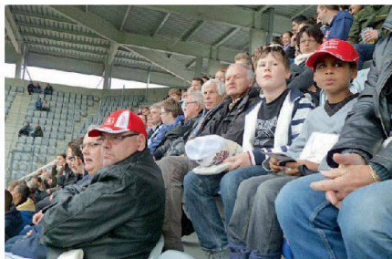
Immer skeptischer: Thuner Fans.

Auf Einladung des Regionalverbands Bern-Solothurn durften am 4. November über 1500 Genossenschafterinnen und Genossenschaffer beim Raiffeisen-Super-League-Spiel zwischen den Genossenschaftsstädten Zürich und Thun mitfeiern. Die Sponsoren Migros Aare und Arena Thun AG ermöglichten diese Überraschung für die Mitglieder im Rahmen des Uno-Jahrs der Genossenschaften. Vor der eindrucklichen Alpenkulisse der Arena Thun stellten die Wohnbaugenossenschaften mehr als ein Viertel der Zuschauer, dennoch übertönten sie die gut organisierten Chöre der Anhänger des FC Zürich nicht. Der FC Thun spielte deutlich unter den Erwartungen und der FC Zürich besser als in letzter Zeit. So endete das Spiel verdient 1:4 für Zürich. Eingefleischte Thun-Fans hatten wenig zu lachen, aber wichtiger war im Stadion dieses Mal das Gemeinschaftserlebnis. (ho)