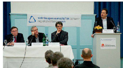
Gemachte Meinungen: Politdiskussion im Volkshaus Zürich.