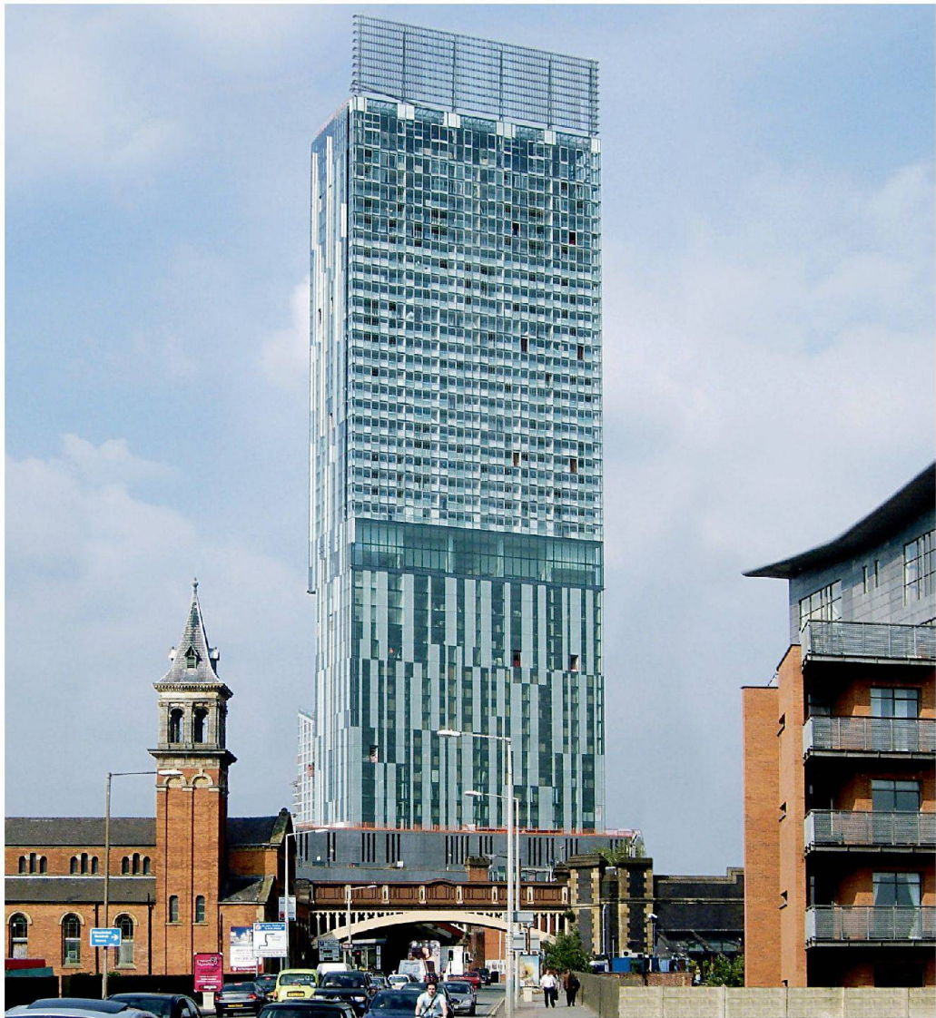
Beetham Tower, Manchester