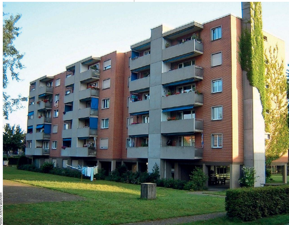
Bei einer Sanierung oft das Erste, das ansteht: kleine und schlecht isolierte Balkone. Im Bild die Siedlung Käppeli der BG zum Stab vor der Sanierung.