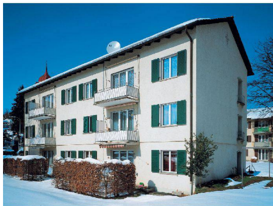
Neue Balkontürme mit Wintergärten lösen das Problem kleiner Balkone. Im Bild die Siedlung der BG Stern in St. Gallen vor und nach (grosses Bild links) der Sanierung.

Aufenthaltsraum. An lauten Lagen bietet die Balkonverglasung zudem einen gewissen Schallschutz, so dass man trotz Strassenlärm relativ ungestört draussen seinen Kaffee geniessen kann. Im Durchschnitt liegt die Temperatur in verglasten Balkonen zwischen acht und dreizehn Grad über der Aussentemperatur, wie eine Publikation des Bundesamts für Energie (BFE) festhält. Beim Einsatz von Isolierglas und einem optimalen Benutzerverhalten verbraucht so die gesamte Wohnung bis zu fünfzehn Prozent weniger Heizenergie. Die Kosten für die Verglasung beziffert das BFE auf 15000 bis 25000 Franken. Das Bundesamt kommt zum Fazit: «Wenn eine maximale wärmetechnische Sanierung der Gebäudehülle