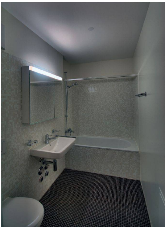
Elegant kommen die Bäder daher.

warfen einen Solitär, der so in den Hinterhof eingepasst ist, dass er einen Kontrast zum Bestand bildet, aber auch an die bauliche Geschichte des Areals erinnert. Der Hofkomplex wird nämlich bereits 1880 als «Hegenheimer Schlössli» geschichtlich erwähnt. Eine Besonderheit ist denn auch die Wahl der Fassade aus Kupfer und Sichtbeton, die für tiefe Unterhaltskosten sorgt. Unter dem wabenartigen Kupferblech ver-