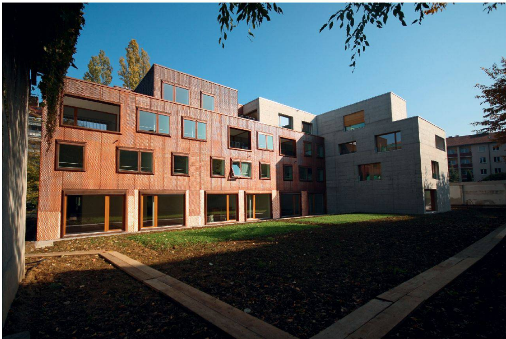
Auf der Rückseite besitzt jede Maisonnette ihren Sitzplatz und damit direkten Zugang zum (noch nicht bepflanzten) Garten.