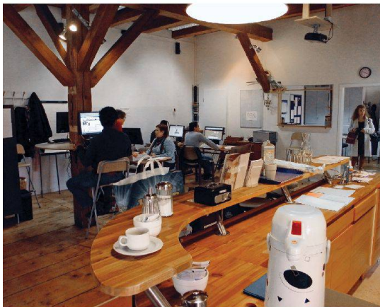
Complino im Zürcher Kreis 4 ist Tauschtreff und Internetcafé in einem. Dass sich die Mitglieder eines Tauschnetzes an einem Ort treffen können, ist sehr wichtig.