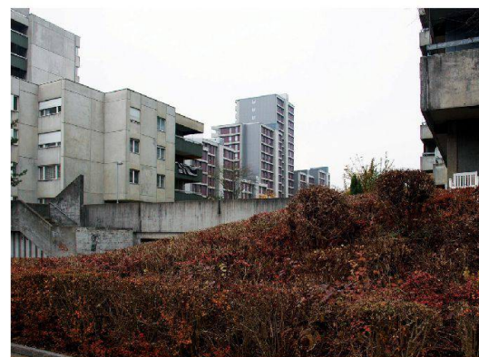
Die Grossüberbauungen Kleefeld Ost und West entstanden zwischen 1969 und 1973. Sie bestehen aus in der Höhe und im Grundriss stark abgestuften Wohnhäusern.