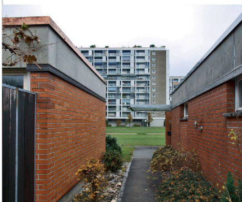
Die Siedlung Schwabgut wurde zwischen 1965 und 1971 erstellt. In acht Hochhäusern und 24 Einfamilienhäusern gibt es 1047 Wohnungen und ein Altersheim.