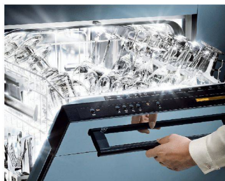
Trocknet ohne Flecken: Adora von V-Zug.