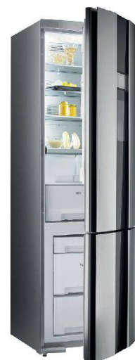
Schön und bequem über ein Display bedienbar: Kühlschrank von Sibir.

Wo gehobelt wird, fallen Späne. Und wo wie die Profis gekocht wird, sieht die Küche danach entsprechend aus. Miele sorgt mit den neuen Profiline-Geräten dafür, dass im Nu wieder aufgeräumt ist. Mit Warmwasser betrieben, schaffen die Geschirrspüler in nur 17 Minuten eine ganze Ladung Geschirr. Weil der Warmwasseranschluss nicht überall möglich ist, sind von