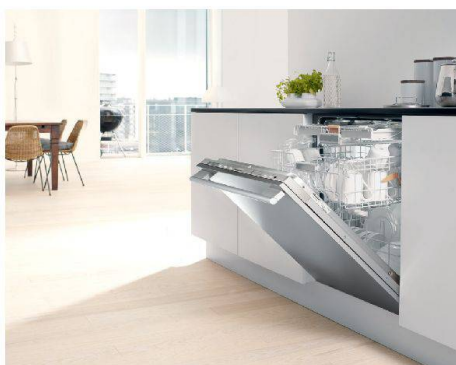
Damit das Geschirr besser trocknet, öffnet sich die Tür am Ende eines Programms automatisch: Miele.