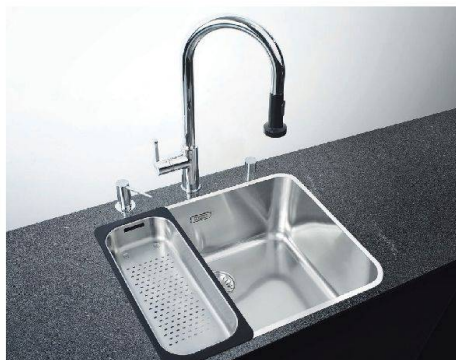
Vereinfacht das Leben in der Küche: Im grossen Spülbecken von Franke findet ein Blech Platz.

■ Weichen Sie das Küchenblech gelegentlich in der Badewanne ein, weil das Spülbecken zu klein ist? Das muss nicht sein: Franke Küchentechnik AG hat das Becken «Largo» neu gestaltet. Dank der neuen Beckengrösse lassen sich Bleche jetzt ganz auf dem Boden ablegen. Als Zubehör gibt es bei dieser Linie ein flexibles Abtropfblech und ein Rüstbrett.