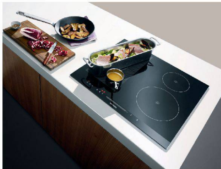
Genau dort erhitzen, wo man will: Induktionstechnologie von Siemens.