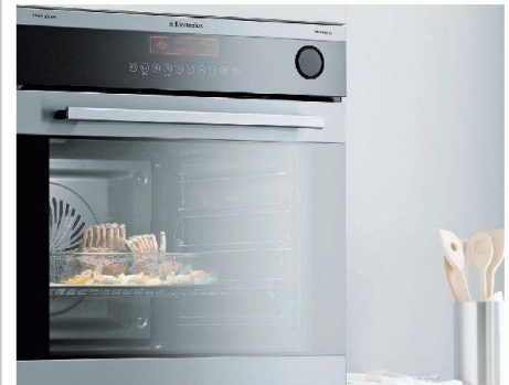
Bietet trotz Standardausführung mehr Platz: Backofen von Electrolux.