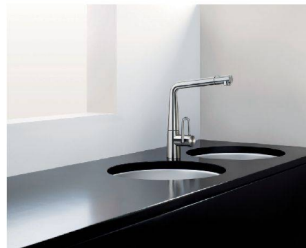
Mit wenigen Handgriffen steht die Armatur für verschiedene Einsätze bereit: Arwa von Similor.

Bis zu 90 Mal wird ein Wasserhahn täglich bedient. Stabile Qualität ist deshalb besonders gefragt. Die neuen Küchenarmaturen der Axor-Linie von Hansgrohe tragen diesem Anspruch Rechnung und sehen dabei auch noch gut aus. Die Armatur für die Wand ist ein besonderer Blickfang und in verschiedenen Ausführungen erhältlich.