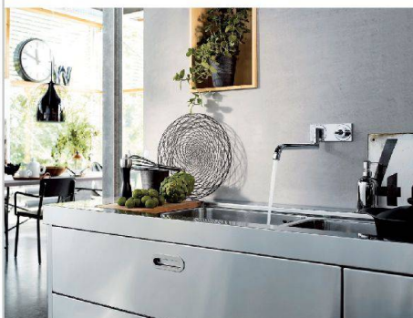
Schafft Platz an der Spüle und füllt bei Bedarf zwei Becken: Axor von Hansgrohe.