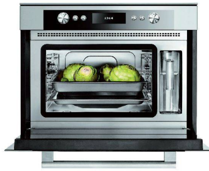
Von der Stiftung Warentest ausgezeichnet: Dampfgarer von Bauknecht.