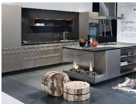
Puristisch und doch wohnlich: Preisgekrönte Stahlküche Pur11 von Forster.

Die neue Stahlküche von Forster hat innert kurzer Zeit zwei Designpreise einheimen können, zuletzt den Red Dot Design Award 2012. Dieser Preis zeichnet nicht nur Funktionalität und gestalterische Kriterien aus, sondern bewertet auch die ökologische Verträglichkeit. Die Linie Pur11 wirkt eleganter als ihre Vorgängermodelle und trägt den Metallcharakter der Küche deutlich zur Schau. Angst vor Fingerabdrücken muss man übrigens keine haben: