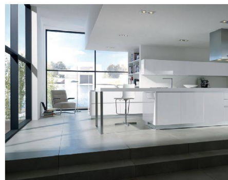
Praktisch: Der integrierte Esstisch bietet zusätzliche Abstellfläche.

Sehr schlicht sind auch die grifflosen neuen Küchen von Hans Eisenring AG . Fast puristisch wirkt das flächenbündige Frontbild. Das Unternehmen aus dem Thurgau betont, dass sämtli-