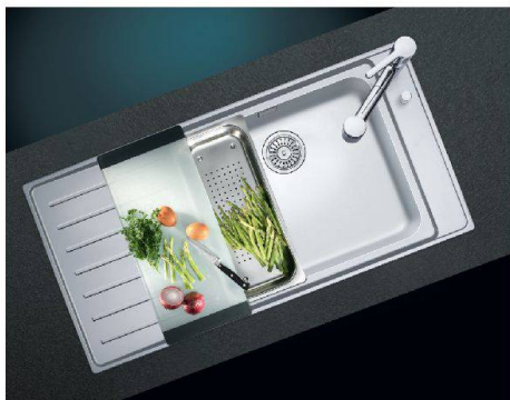
Gutes Design und hohe Funktionalität: Rüst- und Wasserzentrum von Suter Inox.

Auswahl und Funktionen sind auch bei den Armaturen sehr breit. Similor Group zum Bei-