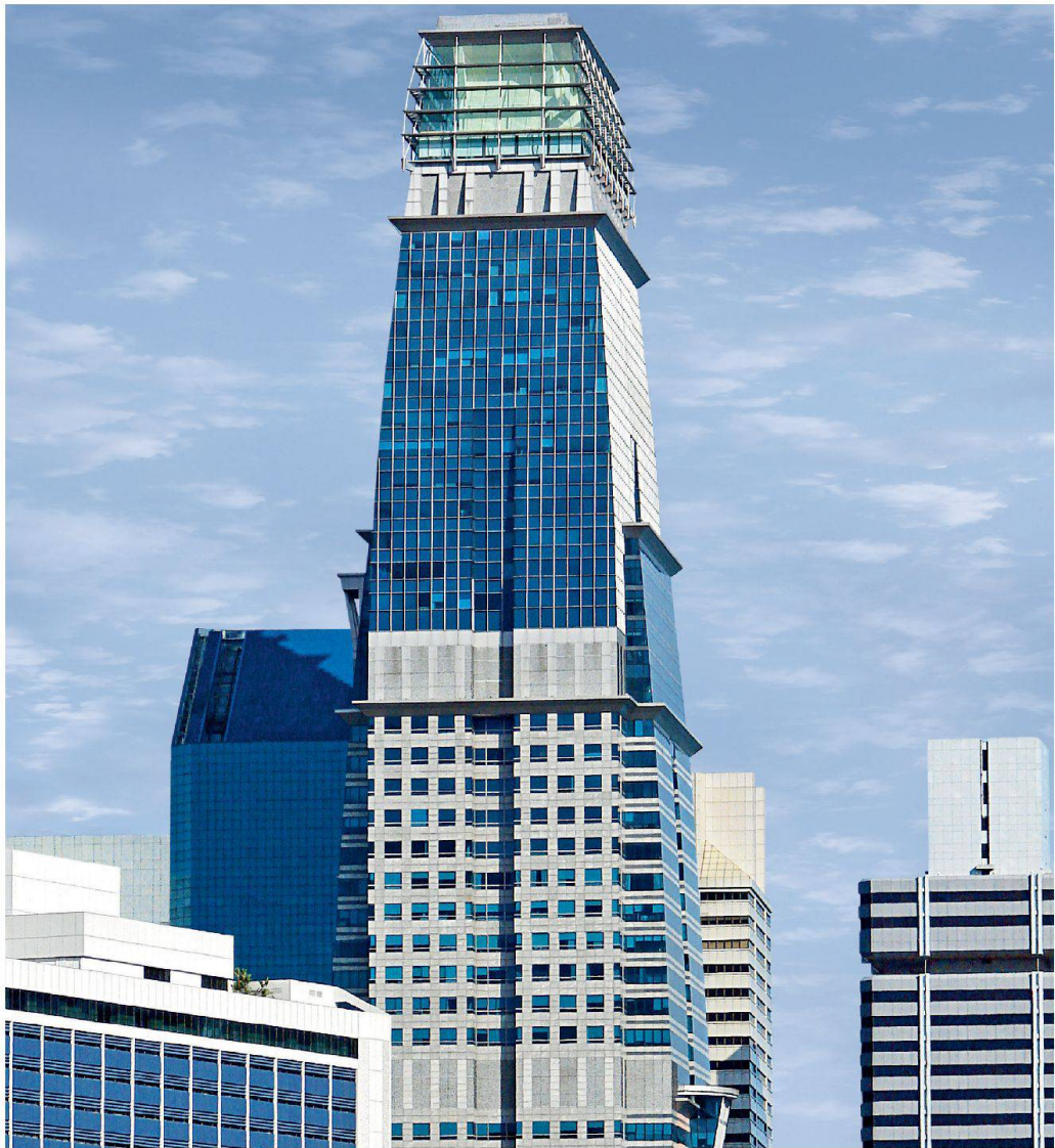
Singapore Capital Tower