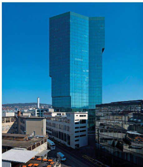
Hochhäuser sind aufwendig und teuer und tragen letztlich kaum zur Verdichtung bei. Trotzdem setzen insbesondere Unternehmen auf ihre grosse Symbolkraft (im Bild: Prime Tower in Zürich).

Das Angebot wird von der Bevölkerung nicht immer angenommen. In Zürich Oerlikon wurden in den vergangenen Jahren zahlreiche Parks angelegt, die weitgehend frei sind von Besuchern.